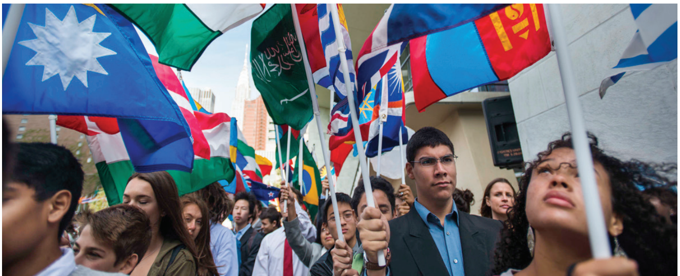
Estudiantes portan las banderas de los Estados Miembros de la Organización de las Naciones Unidas durante la Campaña de la Paz en Nueva York, 2015.

El 8 de noviembre de 2007, la Asamblea General de la Organización de las Naciones Unidas aprueba la Resolución 62/7, donde se señala que la democracia es un valor universal basado en la voluntad libremente expresada de los pueblos de determinar su propio sistema político, económico, social y cultural 1 , motivo por el cual se decreta el 15 de septiembre como el Día Internacional de la Democracia.