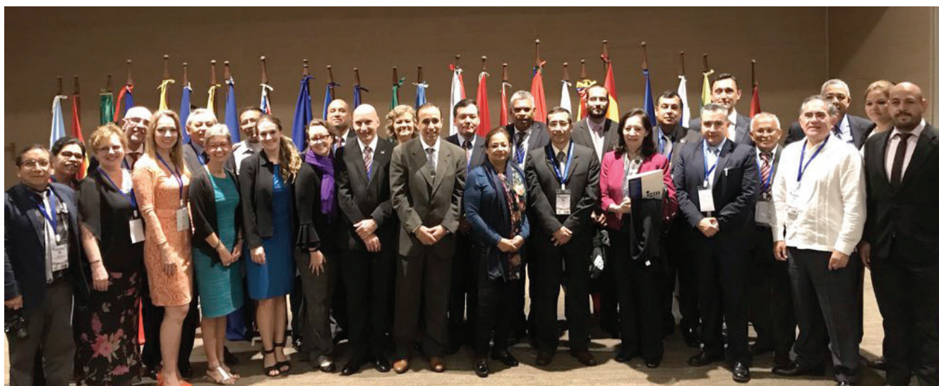
Participantes da 48ª Reunião do Conselho Diretivo do IPGH

De 22 a 25 de outubro, realizou-se a 48ª Reunião do Conselho Diretivo na cidade de Santa Cruz, Bolívia.