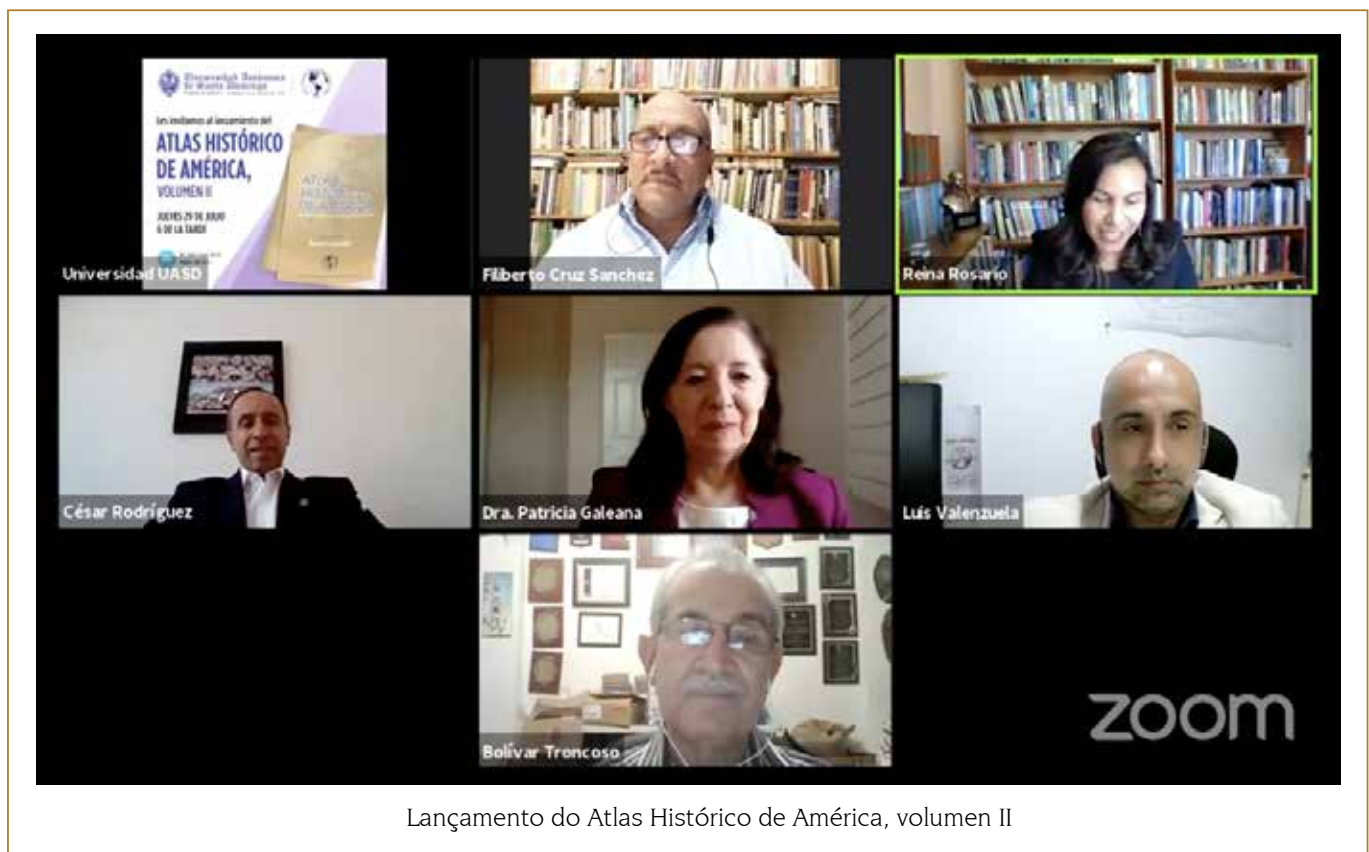
Lançamento do Atlas Histórico de América, volumen II