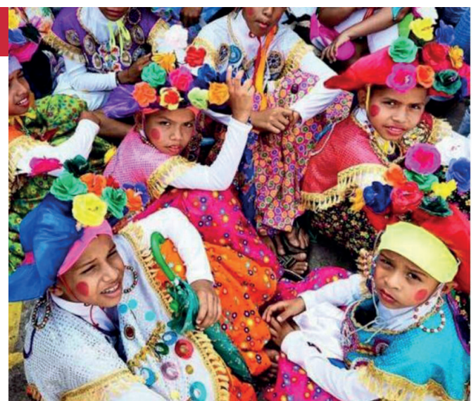
FOTO: HAROLD VARELA (2020). TEMA: CARNIVAL DE LOS NIÑOS (BARRANQUILLA, COLOMBIA).

Consulte el programa de la actividad: http://adhilac.com.ar/wp-content/uploads/2021/03/5toCong-Inte-Historia-Ciencias-Sociales-Michoacan-Mexico.pdf