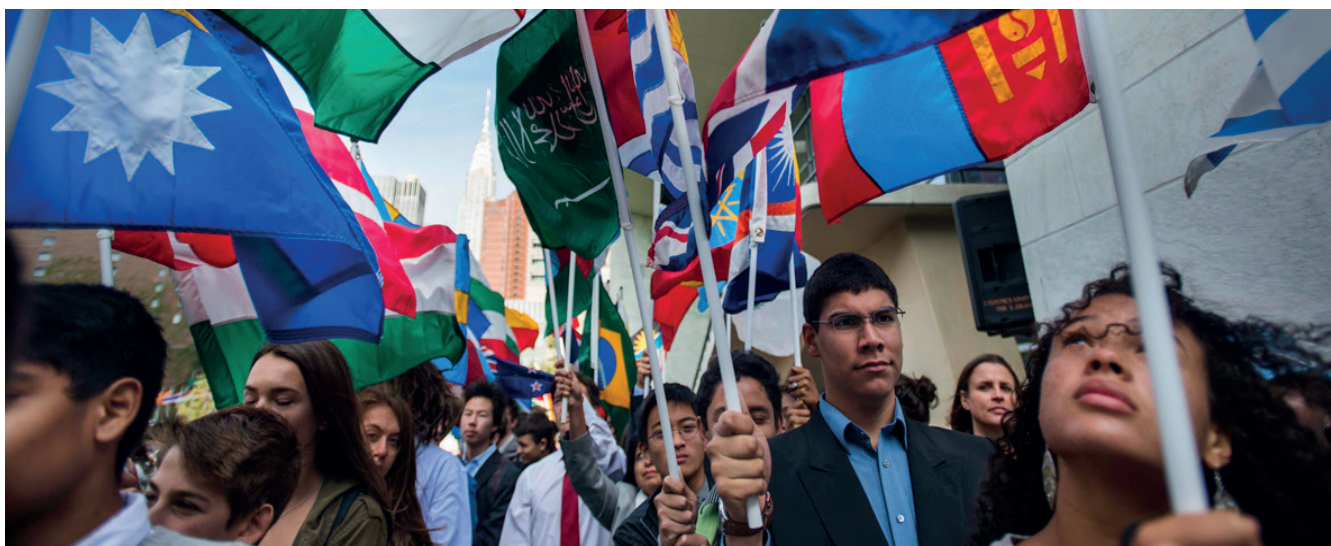
Os estudantes carregam as bandeiras dos Estados Membros da Organização das Nações Unidas durante a Campanha pela Paz em Nova York, 2015.

Em 8 de novembro de 2007, a Assembleia Geral da Organização das Nações Unidas aprova a Resolução 62/7, que declara que a democracia é um valor universal baseado na vontade, expressa livremente pelo povo, de determinar o seu próprio sistema político, econômico, social e cultural 1 , razão pela qual é decretado em 15 de setembro como o Dia Internacional da Democracia.